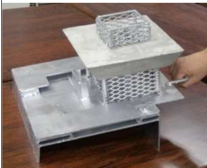
海藻カートリッジ