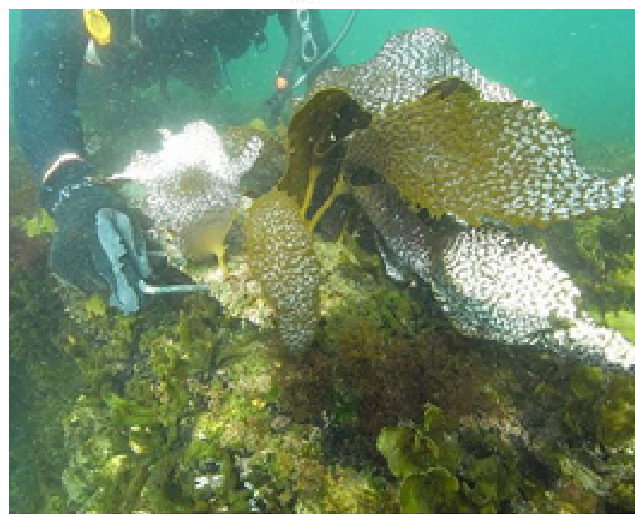
ダイバーによる取り付け状況